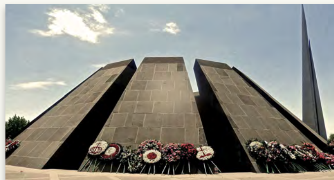
Zirkernakaberd in Jerewan - Denkmal für die Opfer des Völkermordes 1915

Buchzeit / Wache Geister Franz Werfel und der Genozid an den Armeniern